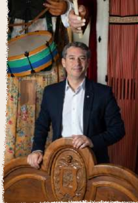
KENNETH MARTÍNEZ MOLINA Alcalde del Vendrell